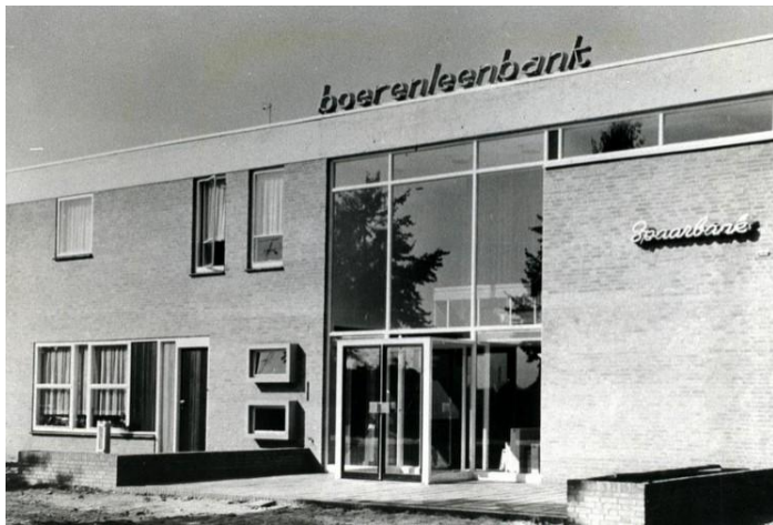
Boerenleenbank Neerkant 1964

dat ook esthetisch aan hoge eisen voldoet. Bij de inrichting van het gebouw is rekening gehouden met de toekomstige ontwikkeling en de steeds meer omvattende taak van de Boerenleenbank. Als Boerenleenbank hebben wij ons tot doel gesteld een zo groot mogelijk dienstbetoon te verlenen aan alle inwoners van Neerkant en onze bijdrage te leveren tot een gezonde financiering van agrarische en middenstands- bedrijven, instellingen van plaatselijk belang enz. Wij hopen ook in staat te zijn in de toekomst onze taak nog beter en doeltreffender te volbrengen, het publiek van Neerkant kan ervan overtuigd zijn, dat wij al het mogelijke in het werk zullen stellen om de service welke wij kunnen verlenen nog aanzienlijk op te voeren. Ons streven is, in het nieuwe gebouw alle inwoners van Neerkant van dienst te mogen zijn.